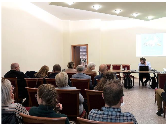
Rysunek 3. Zdjęcie ze spotkania konsultacyjnego cz.1.