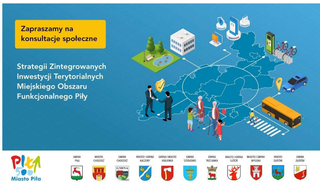
Rysunek 1. Baner na strony internetowe gmin