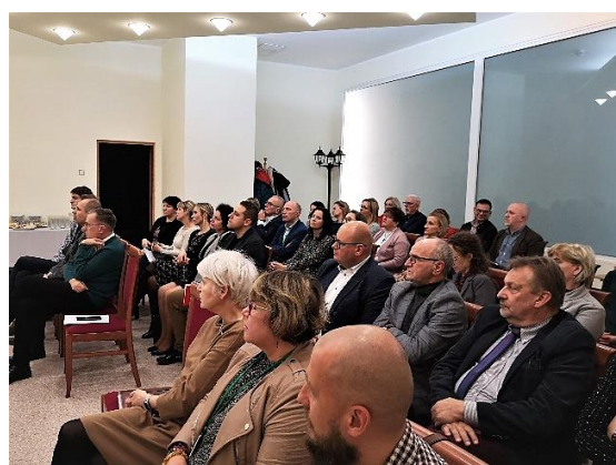
Rysunek 6. Zdjęcie ze spotkania konsultacyjnego cz.4.