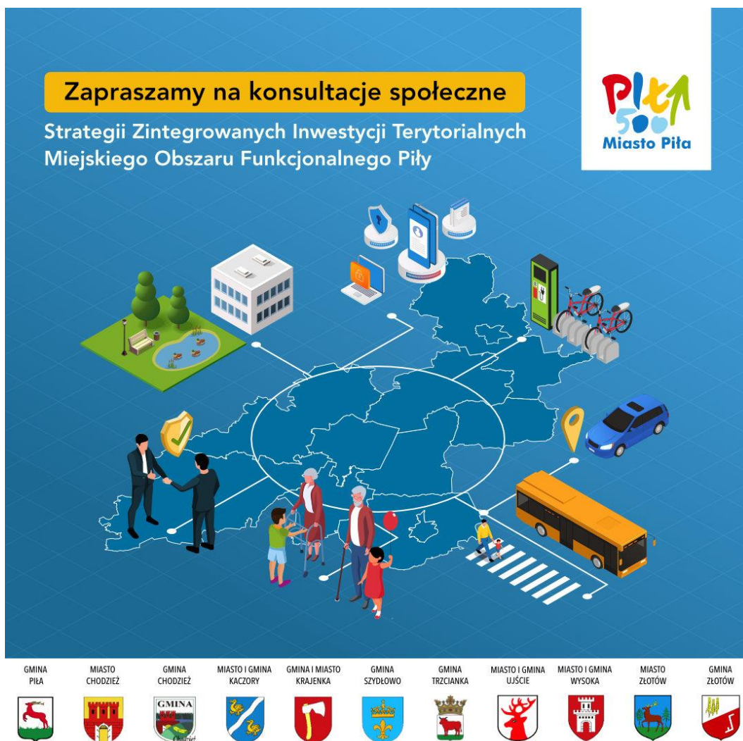
Rysunek 2. Baner na social media gmin