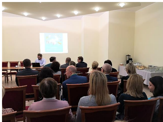
Rysunek 4. Zdjęcie ze spotkania konsultacyjnego cz.2.