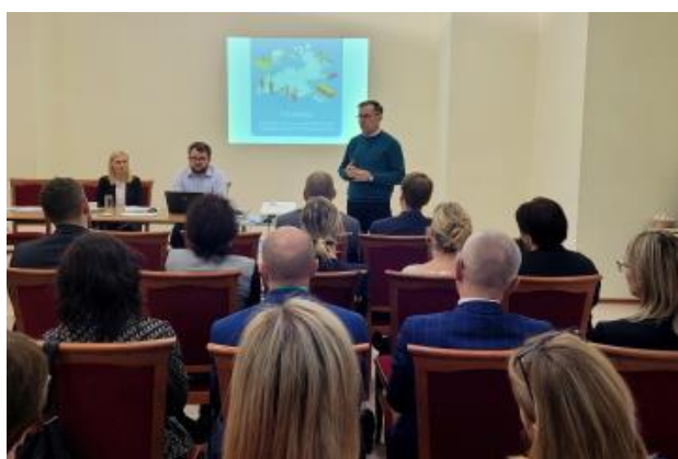
Rysunek 5. Zdjęcie ze spotkania konsultacyjnego cz.3.