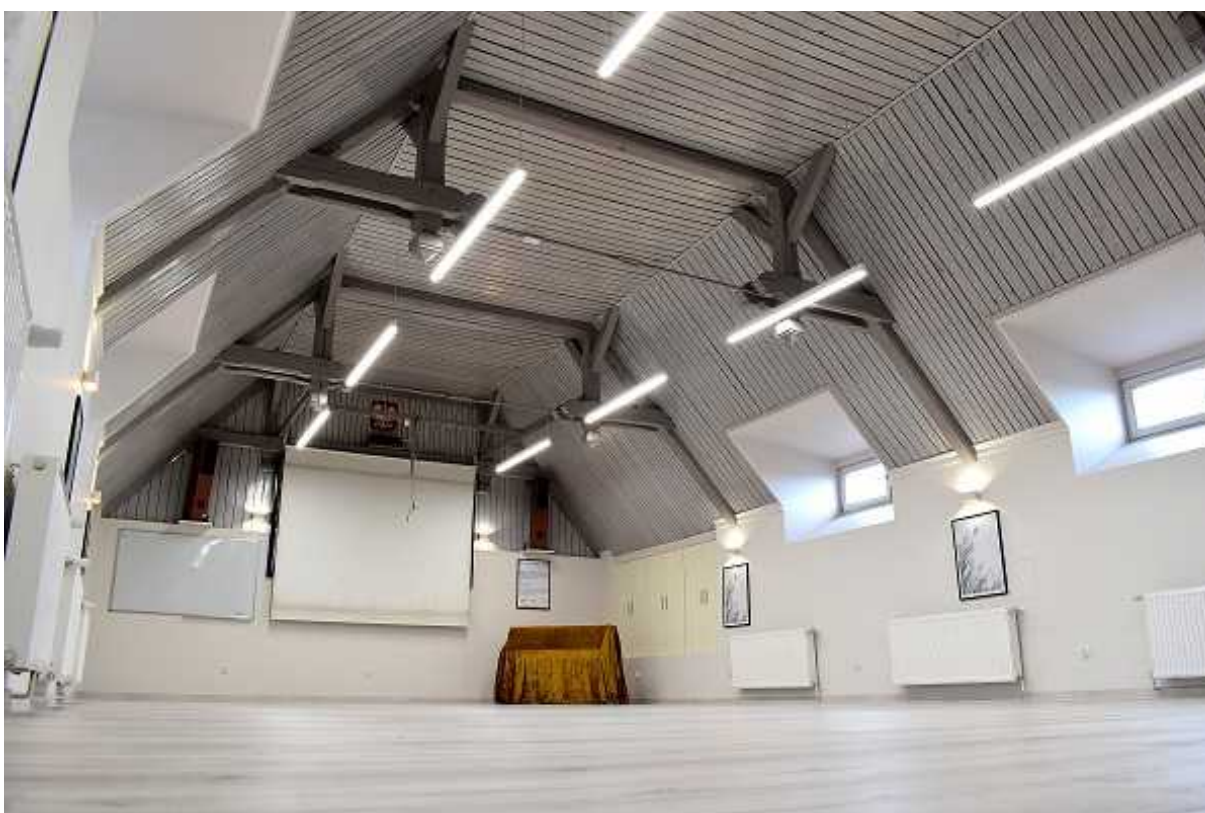
Odnowiona aula szkolna na poddaszu budynku