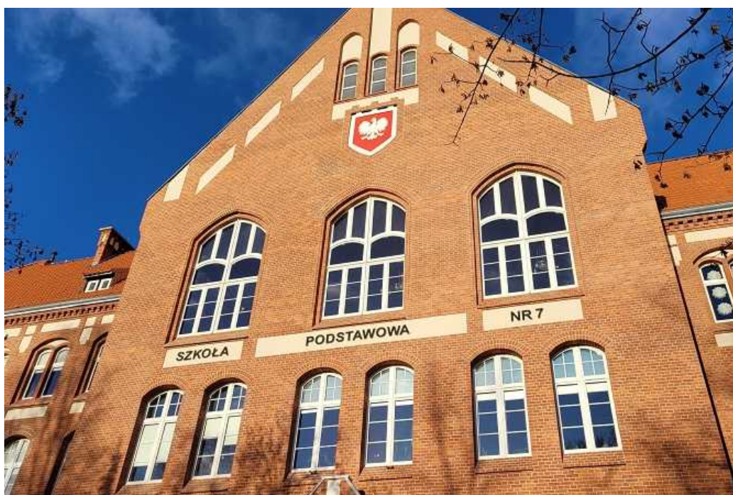
Górna część fasady budynku