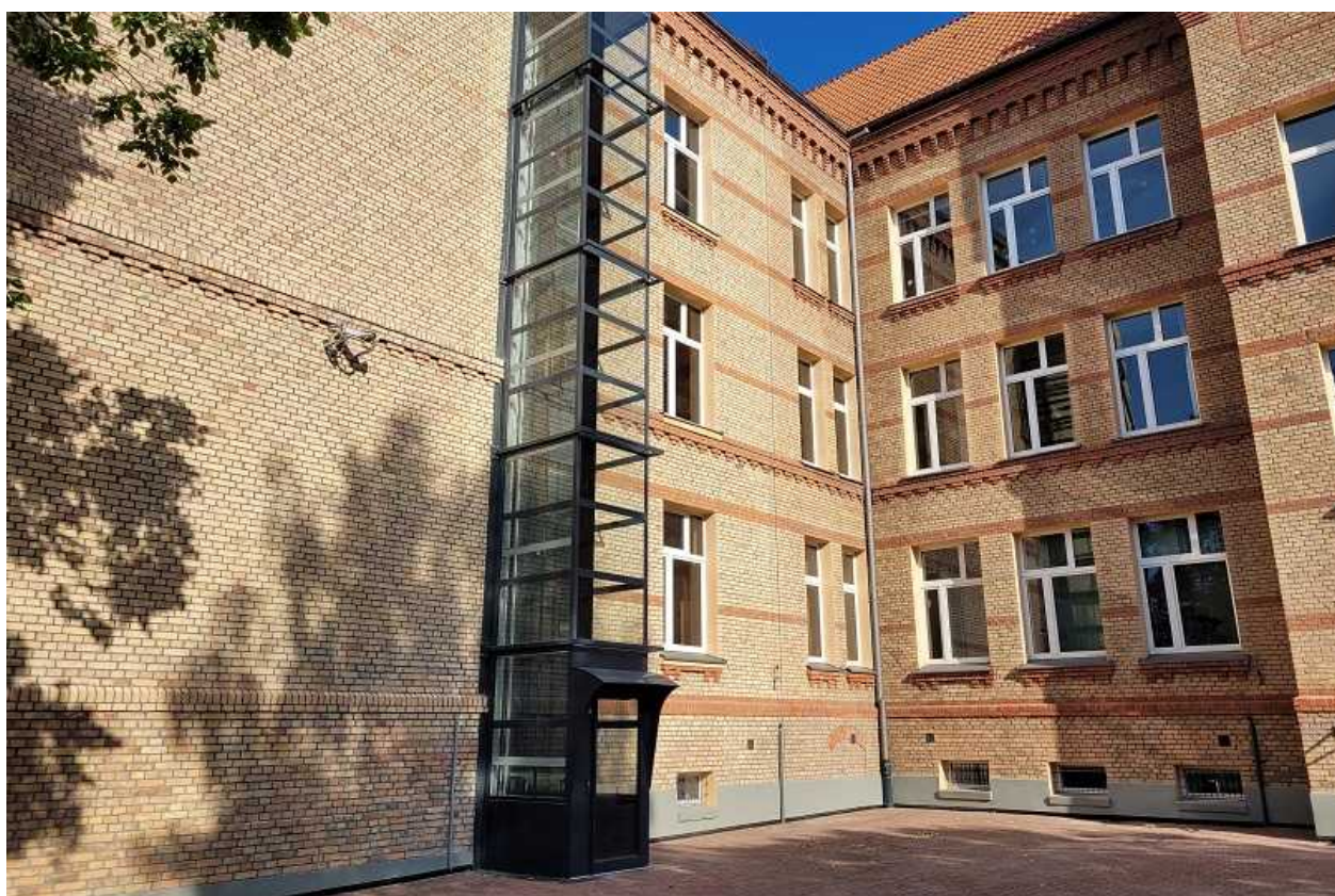
Widok odnowionej elewacji wraz z windą dla niepełnosprawnych

Wygląd szkoły po przeprowadzonych pracach remontowych przedstawiają poniższe zdjęcia.