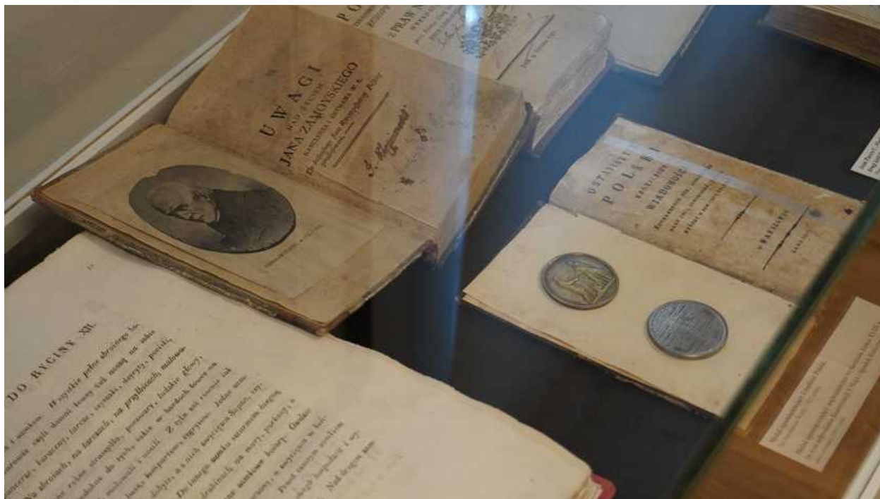
Fragment zbiorów muzealnych