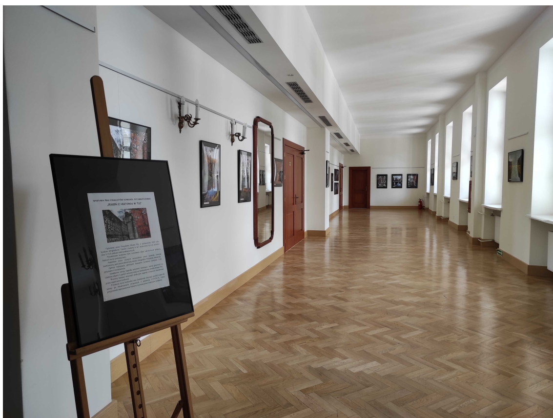
Widok ogólny wystawy przed otwarciem

Poniżej przedstawiono dokumentację zdjęciową wystawy.