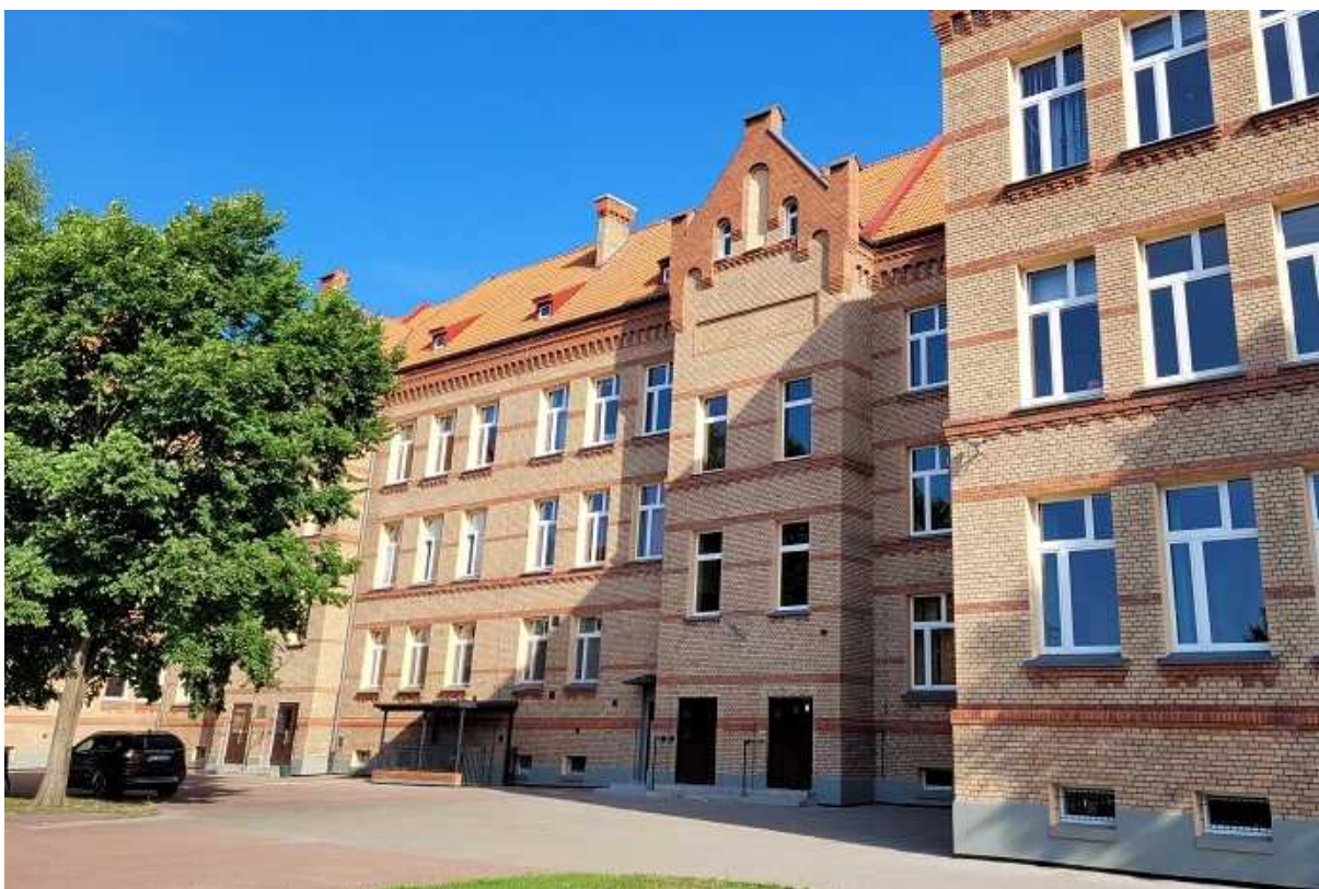
Odnowiona elewacja od strony południowej