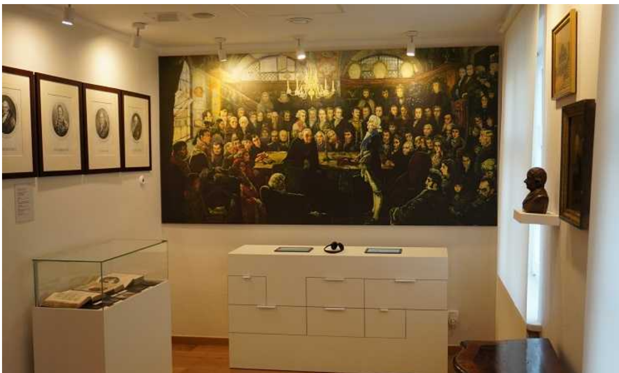
Widok ekspozycji z urządzeniami multimedialnymi