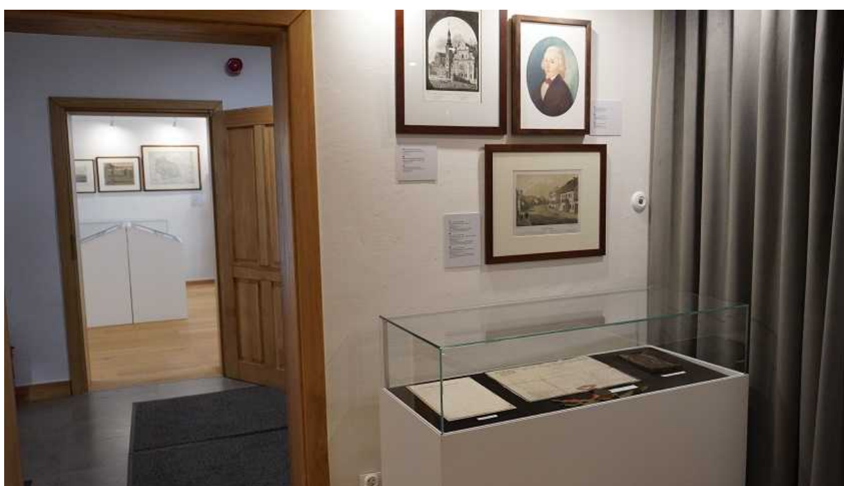
Zmodernizowane sale ekspozycyjne