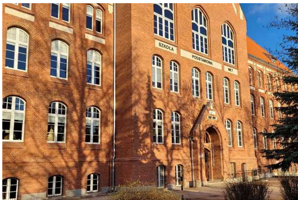
Odnowiona elewacja od strony południowej

Poniżej zaprezentowano zdjęcia przedstawiające obecny wygląd odnowionej elewacji obiektu.