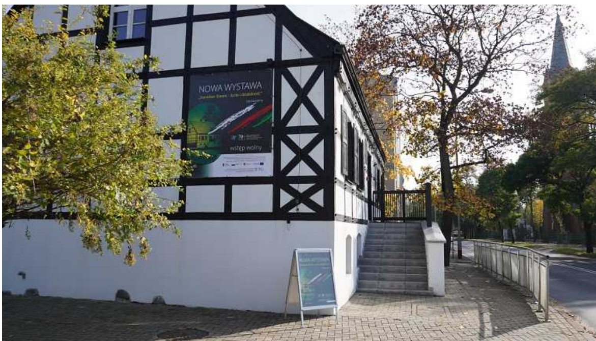
Odnowiona, charakterystyczna elewacja budynku

Poniższe zdjęcia przedstawiają aktualny wygląd muzeum oraz ekspozycji.