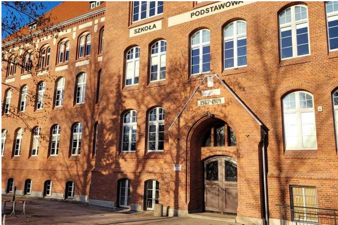
Część fasady budowli z widocznym wejściem głównym