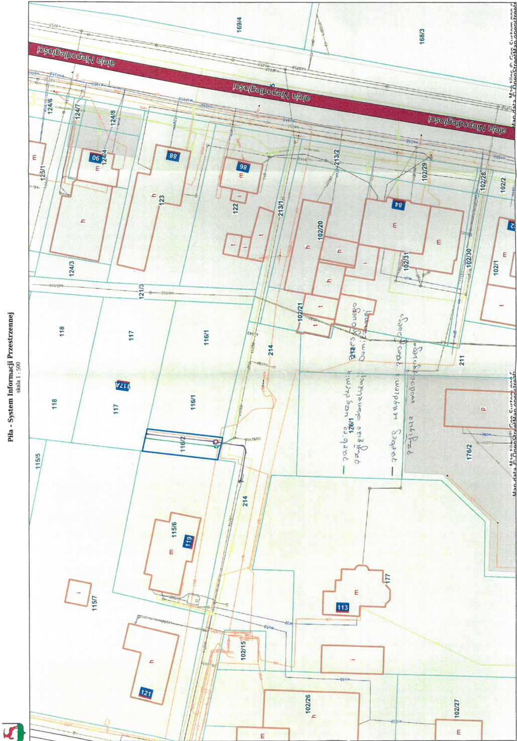
Pila - System Informacji Przestrzennej skala 1 : 500